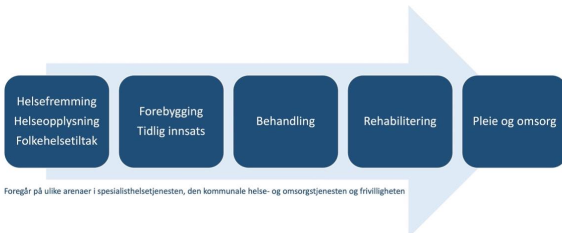
Figur 2: Lærings- og mestringstilbud innen ulike tjenesteområder

Gruppetilbud er læringsaktivitet med to eller flere deltakere. Andre betegnelser som benyttes om tilbudene er blant annet mestringsgrupper, mestringskurs, pasientkurs, gruppeopplæring, pasient- og pårørendeskoler, støttegrupper med mer.